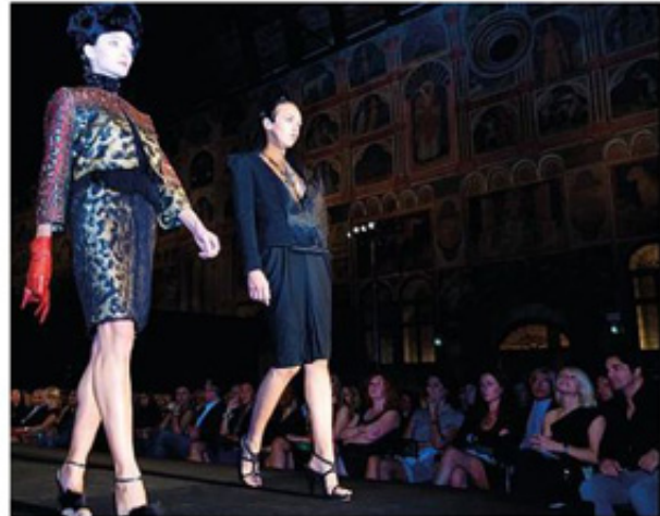
Un momento della sfilata pro Iov 2012 ma la griffe era Gattinoni, in alto l'interno del Salone, a destra un modello Sarli