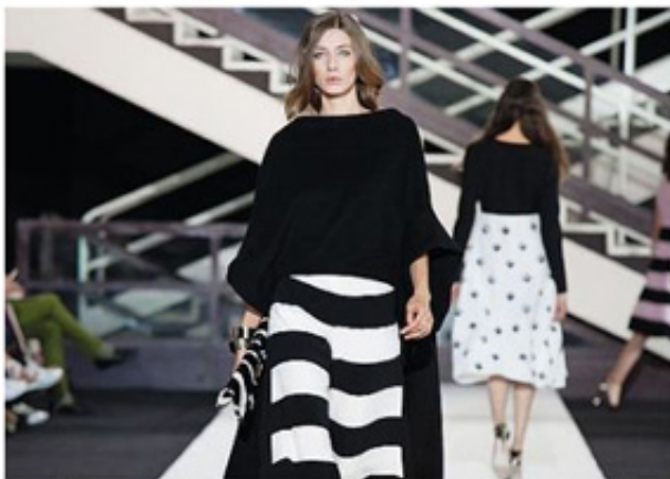
Una delle creazioni di Rocco Palermo per la maison di alta moda Sarli